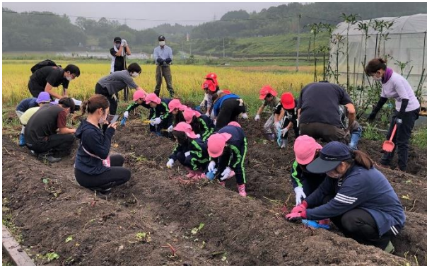
<10月13日 さつまいもの日に収穫>